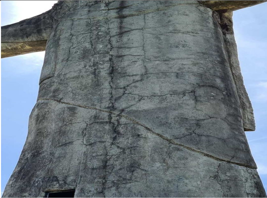
Legenda: Imagem mais aproximada das rachaduras