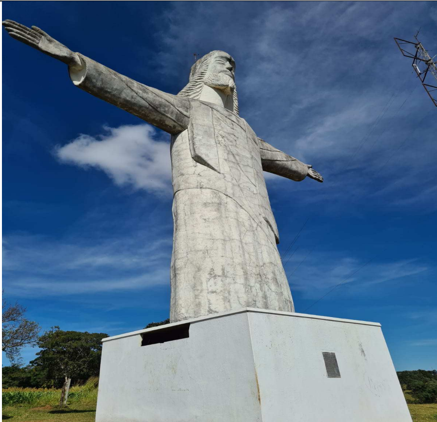
Legenda: Imagem do monumento do Cristo